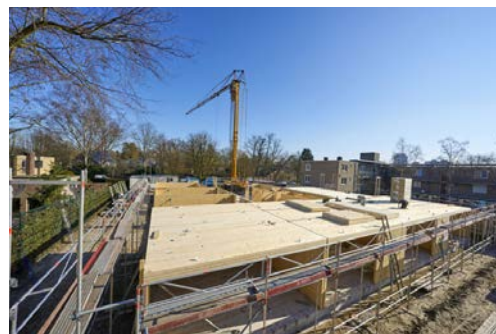
Bouwproject WonenZoals in 's-Hertogenbosch in aanbouw, CLT (kruislaaghout), van Brabant Wonen in samenwerking met Hendriks Coppelmans.