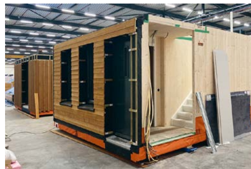
Modulair woningconcept Optimus, ontwikkeld door NBArchitecten in samenwerking met. Timmerfabriek Frank van Roij in opdracht van 4 woningcorporaties: Compaen, Kleurrijk Wonen, Joost, 'Thuis.

Een volgende stap naar een circulaire bouweconomie is combinatie met andere biobased materialen, bijvoorbeeld isolatie (platen, dekens, inblaas).