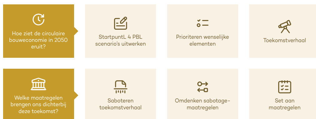
Figuur 1 | Future Design proces

Met een duidelijk beeld van de toekomst en de uitdagingen op de weg daarnaartoe is een uitgebreide longlist van maatregelen opgesteld. De werkgroep heeft vervolgens een robuustheidscheck uitgevoerd aan de hand van de scenariostudies van het PBL. Daarmee is een selectie gemaakt van maatregelen die hieronder worden beschreven. De selectie bestaat uit maatregelen die in alle scenario's van de Ruimtelijke Verkenning 2023 een significante bijdrage zullen leveren aan het realiseren van de circulaire bouweconomie.